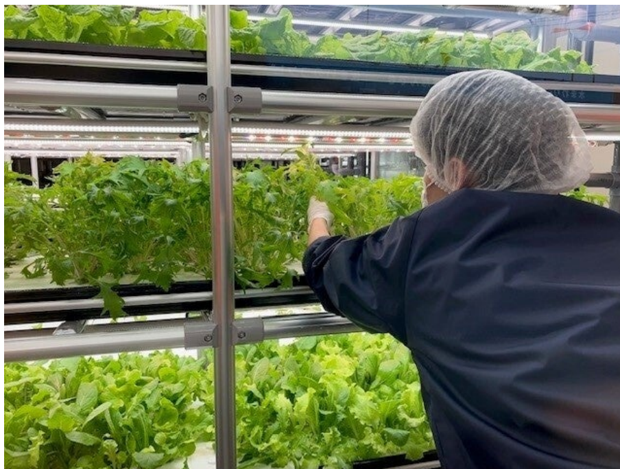
レタス・ルッコラ・イタリアンパセリ・バクチャーなどを作っています。

B型事業所は、障がいのある方を対象とした就労支援を目的とする福祉事業所です。「minalab.」では、今後様々な就労メニューを企画し就労支援を進めてまいります。第一段は、埼玉県三郷市において、施設外就労の場として「三郷Lab」を設立し、「水耕栽培の管理」と「野菜の販売」を行っています。